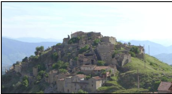
Aghouren, village vidé et bombardé en 1957

On ne peut pas dire que « le pays des droits de l'Homme », se soit très bien comporté, à ce moment-là.