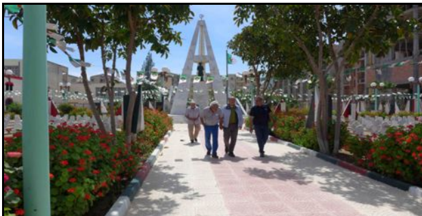
Cimetière mémorial d'Ighzer Amokrane, en Kabylie

La Guerre d'Algérie – dont ils n'ont pu parler - a dévasté leurs jeunesse. Aujourd'hui, au moment de toucher leurs « retraites du combattant », ils disent : « Cet argent, nous ne pouvons pas le garder, pour nous-mêmes. » Alors, ils le collectent et le redistribuent à des associations, en Algérie. Avec ces projets solidaires, leurs cœurs ont rajeuni. Eux, qui s'étaient tus si longtemps, parlent enfin, rencontrent des jeunes... Et retournent en Algérie.