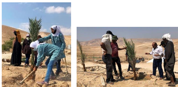
Les dernières plantations en septembre 2020

806 arbres plantés en septembre (plantation prévue en mai mais repoussée à cause de la pandémie) dont 50 dans 4 écoles). 29 bénéficiaires répartis essentiellement à Al Auja et Deir Hijleh (voir la carte).